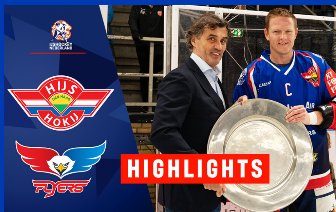
▲ Hijs Hokij wint de Ron Berteling Schaal 2022