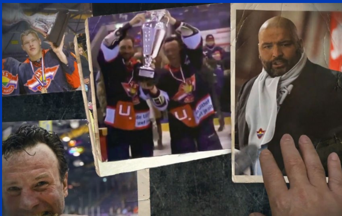
▲ De meest succesvolle periode van Hijs Hokij

Klik op een afbeelding om de video te bekijken.