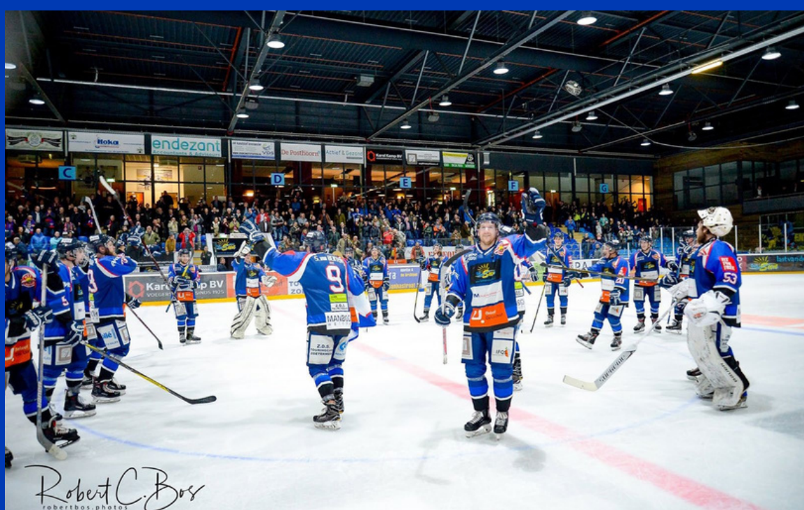
▲ Hijs Hokij wint na penaltyshots van UNIS Flyers!