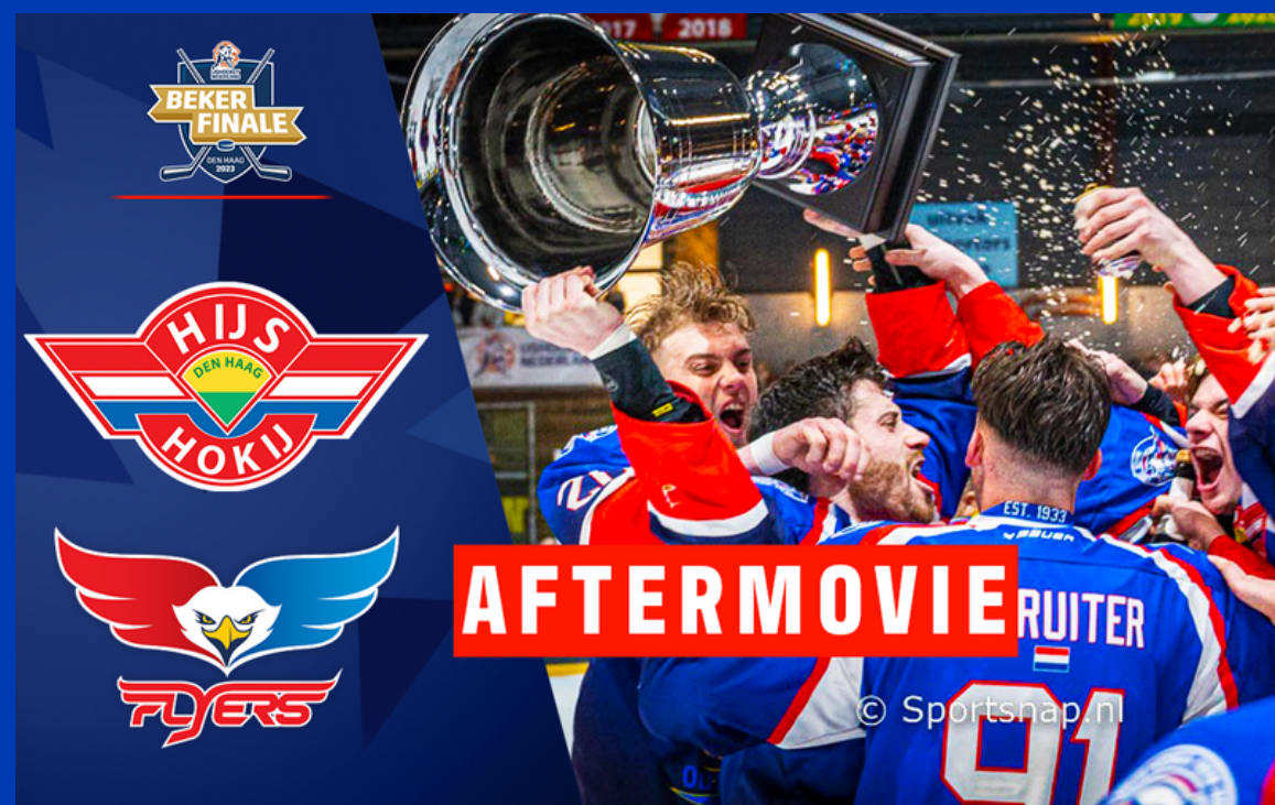
▲ Bekerfinale aftermovie 2023