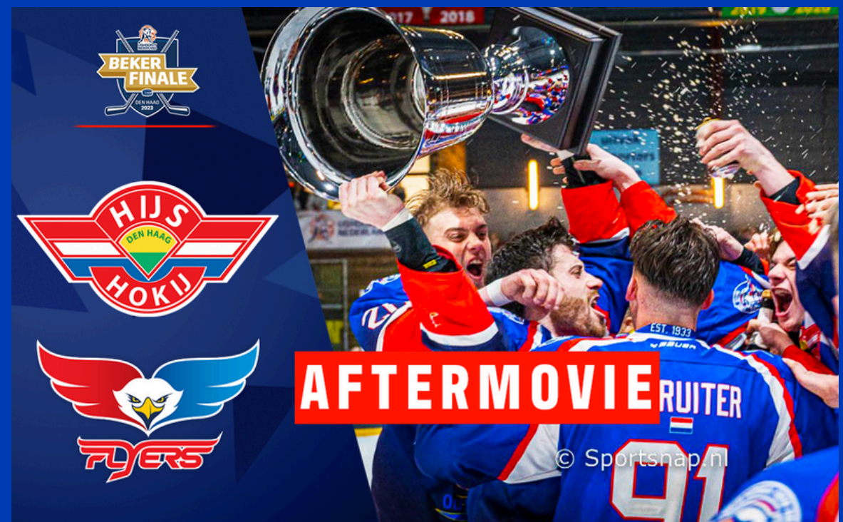
▲ Bekerfinale aftermovie 2023