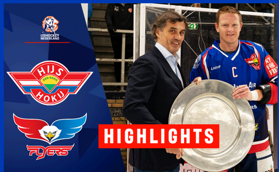
▲ Hijs Hokij wint de Ron Berteling Schaal 2022