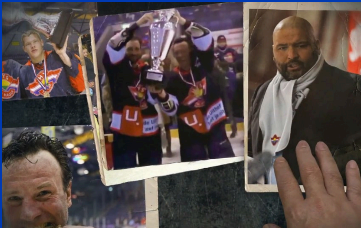
▲ De meest succesvolle periode van Hijs Hokij

Klik op een afbeelding om de video te bekijken.